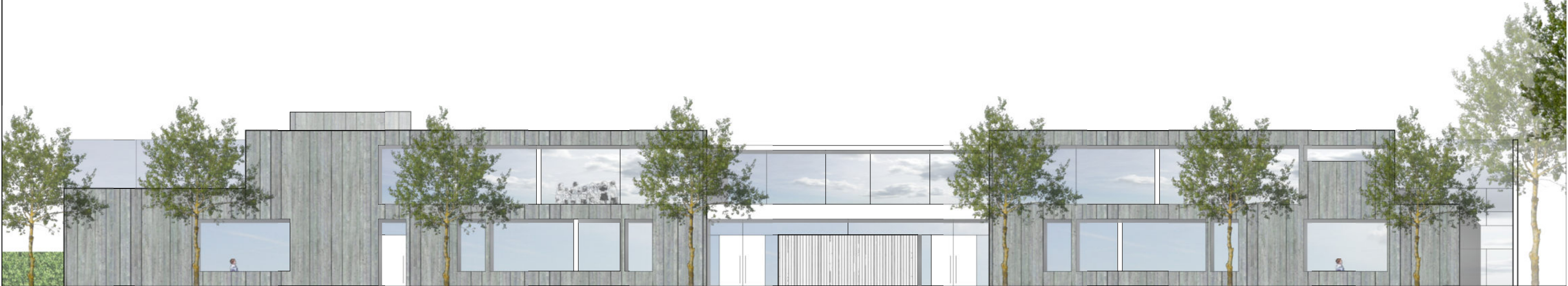
Süd-Ost | 1:200