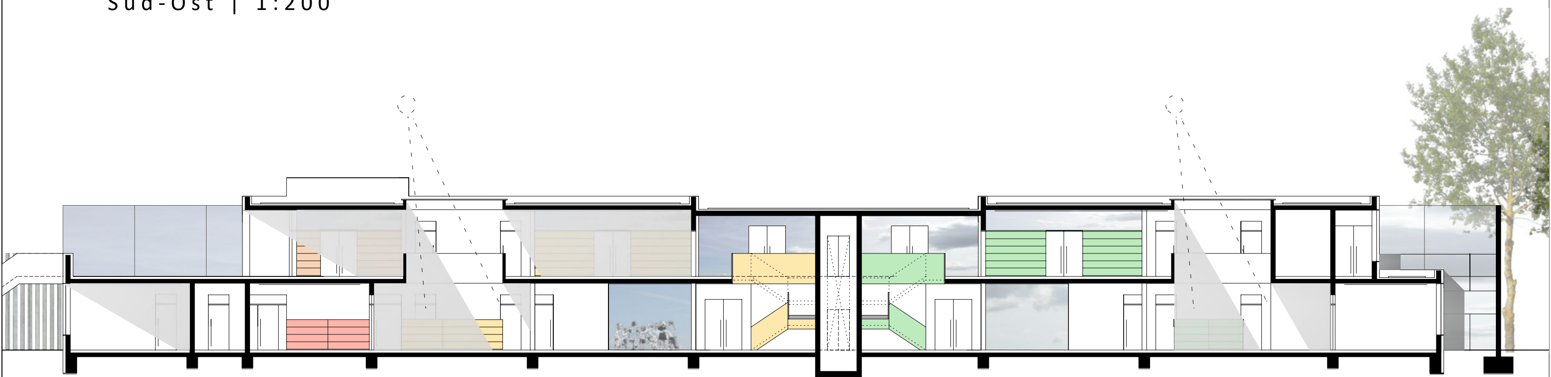
Längsschnitt | 1:200